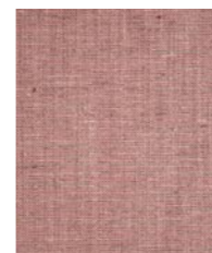
3522 (Y4) Harper