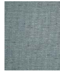
4533 (Y1) Harper