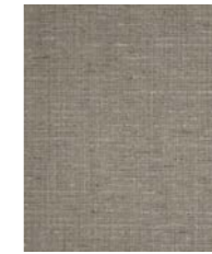
4520 (Y3) Harper