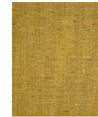
6625 (Y5) Harper