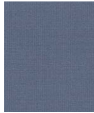
04604 (F1) Crisp