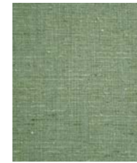
5431 (Y0) Harper