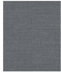
04022 (F2) Crisp

Einsetzbar für Programme · Applicable for programs · Van toepassing voor programma's - MELOUNGE, P4