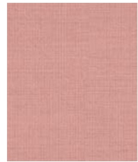
04712 (F4) Crisp