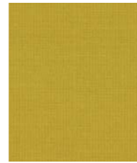
04211 (F5) Crisp