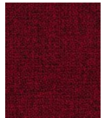
64013 (V4) Step Melange