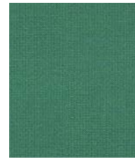
04605 (F0) Crisp