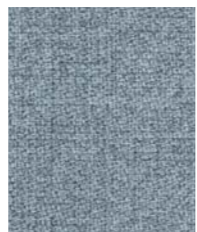
67004 (V1) Step Melange