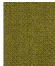
68119 (V0) Step Melange